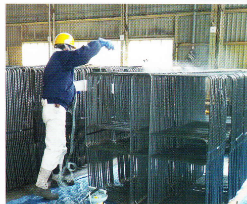
鉄鋼メーカー工場内(噴霧)