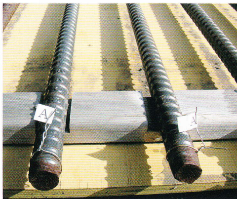
スチールバリア W100 270日暴露